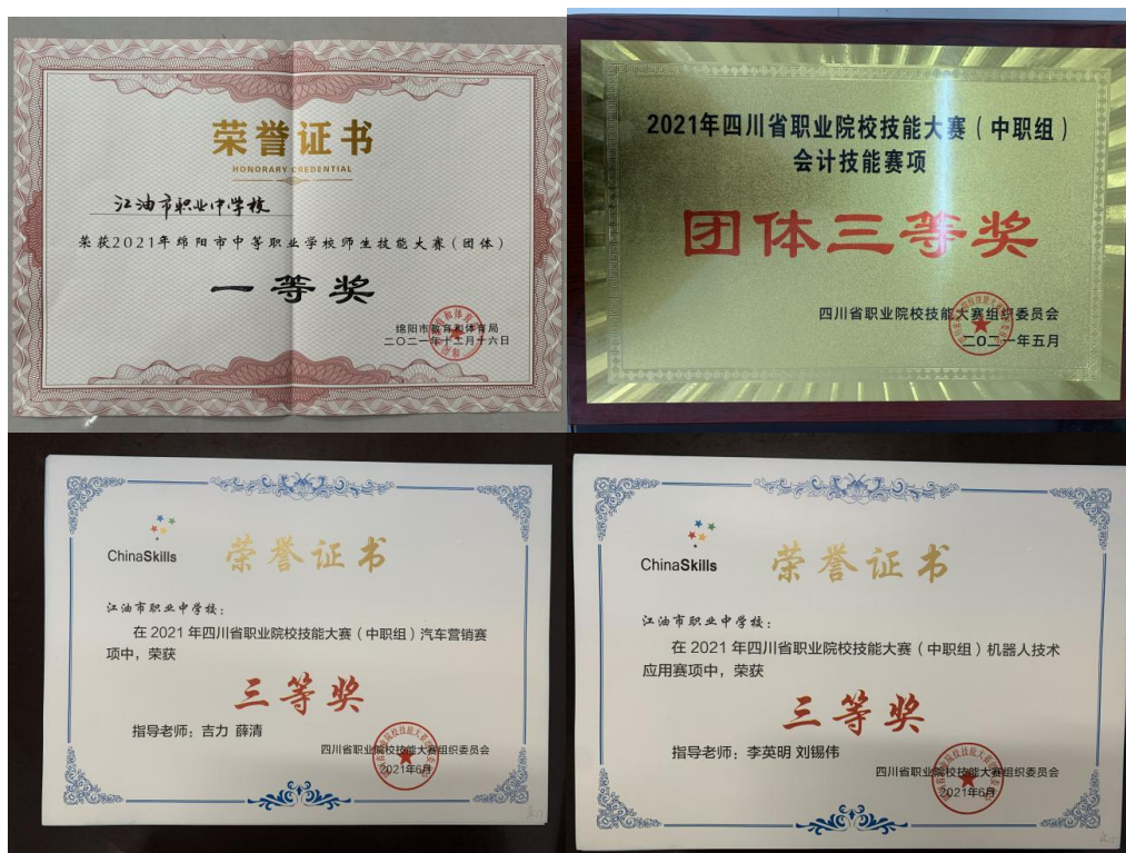
图 5 技能大赛获奖证书（部分）