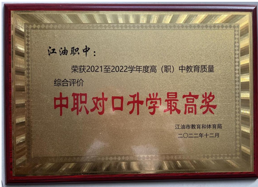
图 6 “中职对口升学”年度综合评价

学校今年 1108 人参加高考，本科上线人数 34 人，专科上线 1074 人。连续多年位居绵阳市同类学校第一。