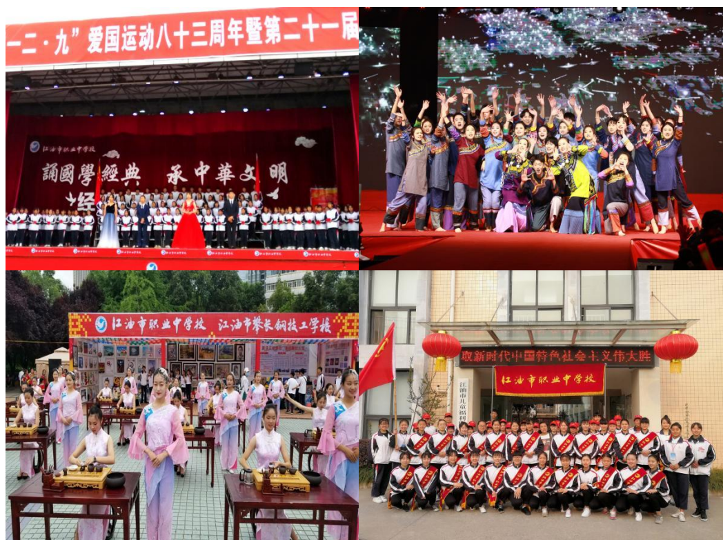
图 2 丰富多彩的校园活动

修订德育工作制度，增补《先进班集体、优秀班主任、德育工作先进个人评选办法》和《班主任学月绩效考核办法》两项制度，依据这两项制度共表彰优秀班主任 63 名、明星班主任 69 名、各类先进学生 244 名。学校荣获 2021 年绵阳市学校德育工作先进集体。