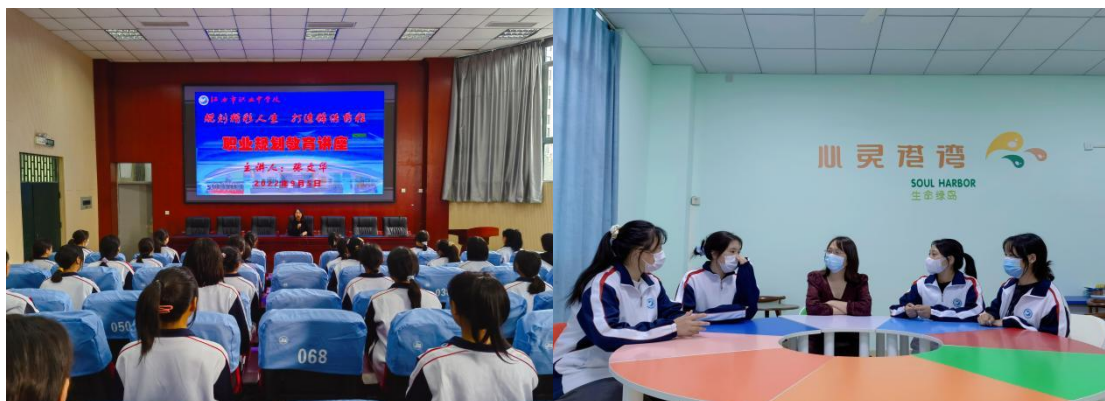
图 4 职业规划与心理健康辅导

学校将就业作为深化校企合作的重要内容，在本地和发达地区多家知名企业建立了稳定的就业基地。结合学校实际，建立、完善就业学生档案，针对社会、企业对毕业生的综合要求，加强就业培训指导、职业道德教育和心理健康教育，引导学生树立正确的择业观和劳动价值观。加强就业学生的跟踪回访，促进就业稳定。