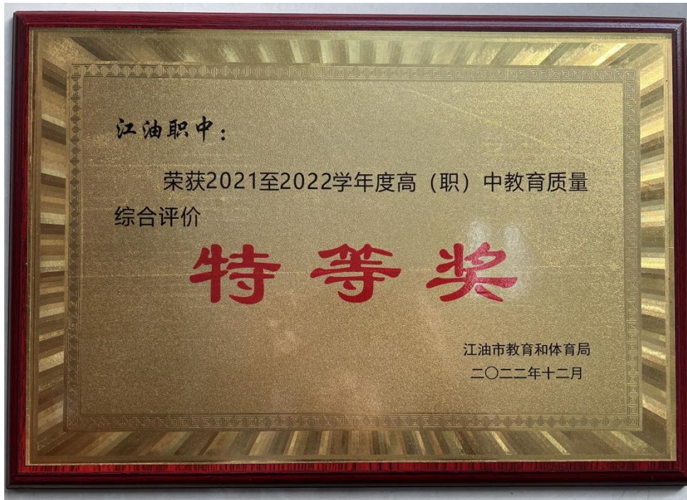
图 7 年度教育质量综合评价