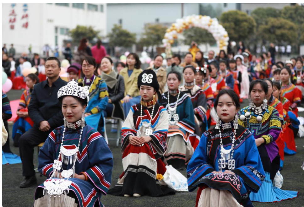
图 8 布托学生欢度彝历新年