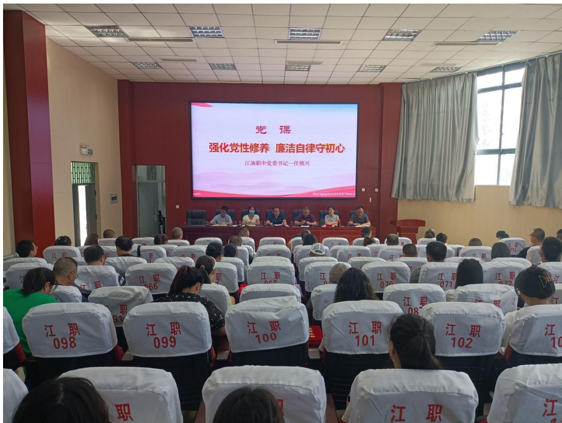
图 1 开展廉洁自律党课学习

学校现有中共党员 108 人，下辖 4 个支部。学校 9 名优秀党员受到教体局党委表彰，第二支部被评为教体局表彰的优秀党支部，学校党委表彰 25 名优秀党员，第四支部被表彰为学校优秀党支部。