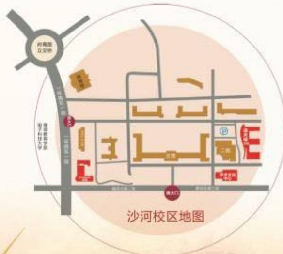
电子科技大学沙河校区地图