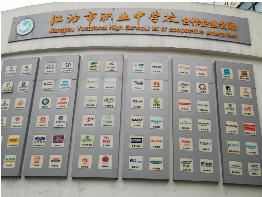
企业文化走进校园