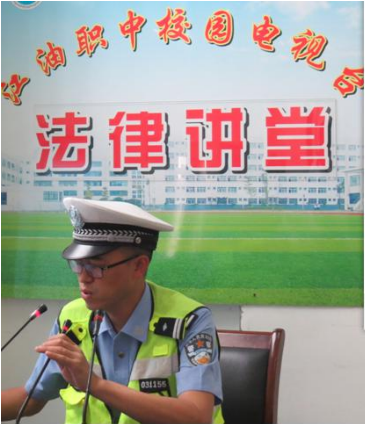
交通安全知识讲座