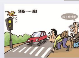
临近时突然横穿车行道，没有人行横道，过街天桥或地道的，须在保证安全的前提下，直行通过，不准在车辆临近时突然横穿。