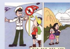
不要乱穿马路，注意红绿灯，听指挥，莫乱穿，要前后注意车辆。