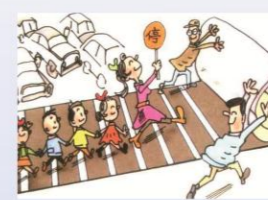
列队横过车行道，须从人行横道迅速通过，没有人行横道的，须直行迅速通过。队伍过长时，应是前中后，分批通过。