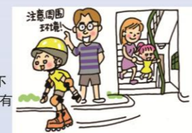
不准在道路上嬉戏，如踢球、溜冰、玩滑板等。